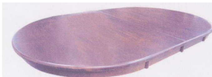
LAUAPLAAT 1TK TABLE TOP 1PC